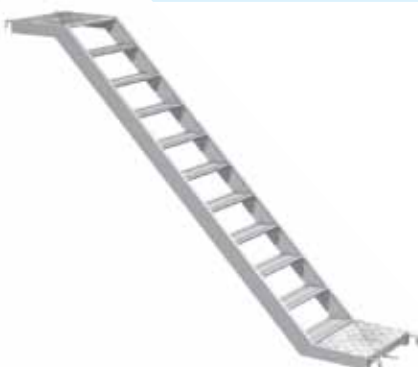
Trappa UTV 3050x2000 4102302 (29,2 kg)

Inre handledare som monteras och låses på trappans vangstycke.