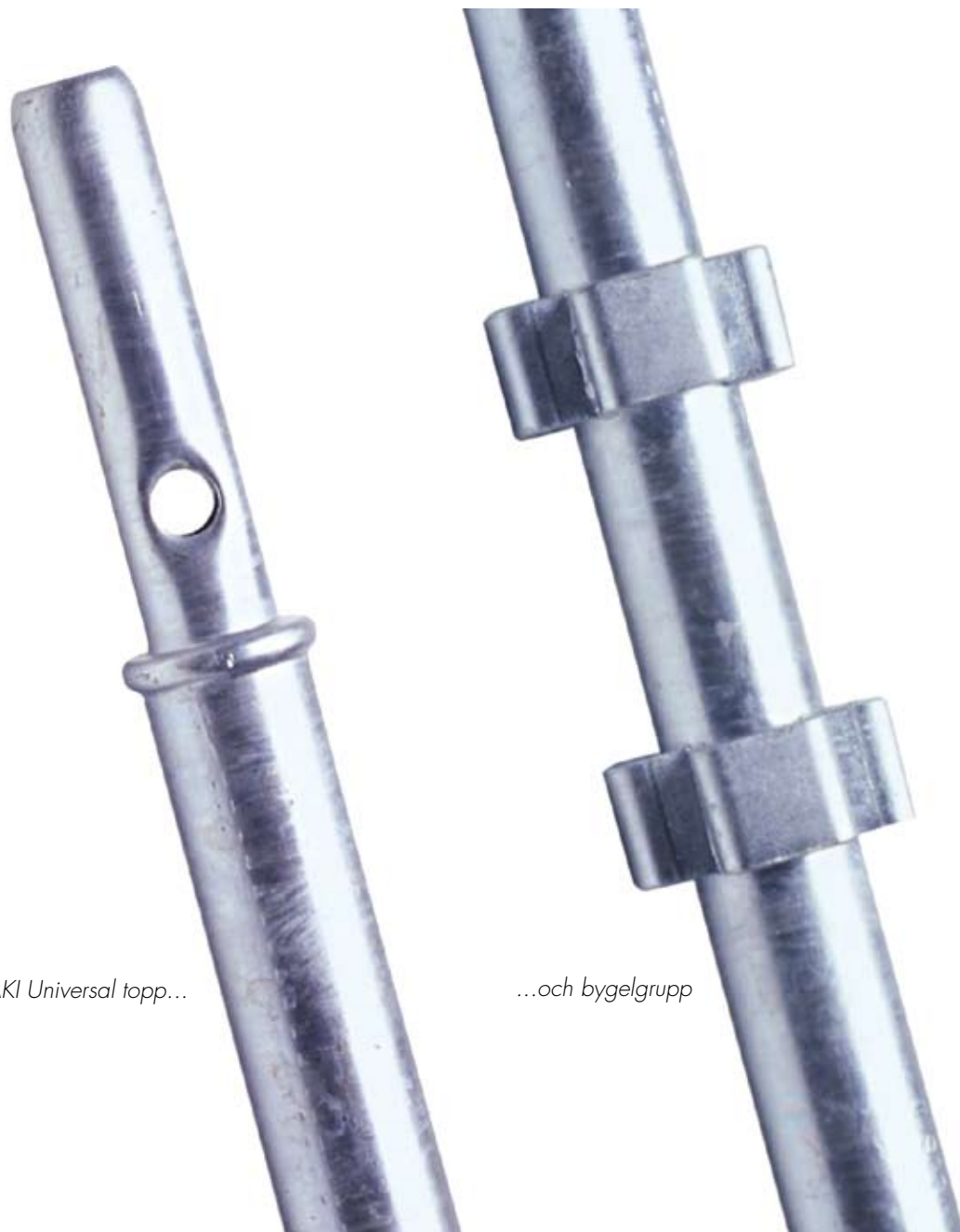
HAKI Universal topp...